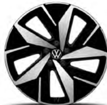
Ystad 20" lettmetallfelger (standard)