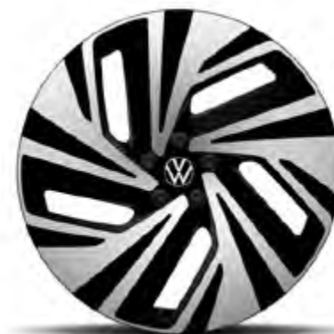
Narvik 21" lettmetallfelger (ekstrautstyr)