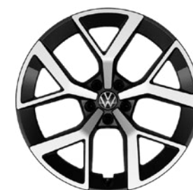
Lettmetallfelger «Zwickau» 8 x 20" med 215/45 R20 dekk