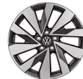
Lettmetallfelger «Edinburgh» 7,5 x 18", med 215/55 R18 dekk