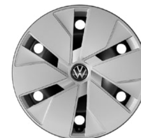
18" Stålfelger 7,5 x 18" 215/55 R18 dekk