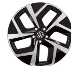
Lettmetallfelger «Wellington» 7,5 x 19", med 215/50 R19 dekk